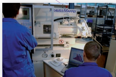
Plate-forme technologique de mise en œuvre des matières plastiques du CIRFAP